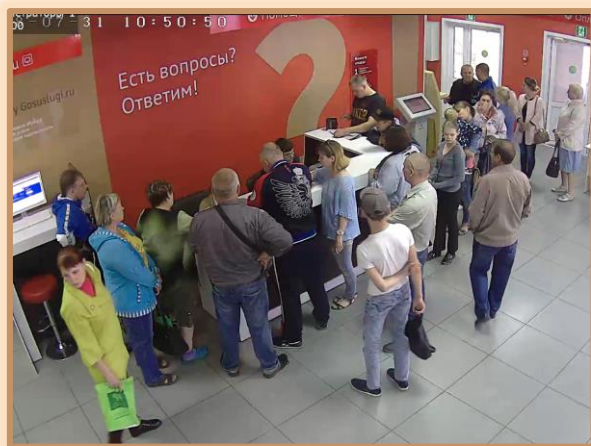
ФОТО ДНЯ 31.07.2018 (ВТОРНИК С 8.00 ДО 20.00)