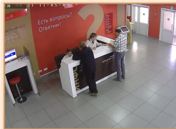
ФОТО ДНЯ 21.08.2018 (ВТОРНИК С 8.00 ДО 20.00)